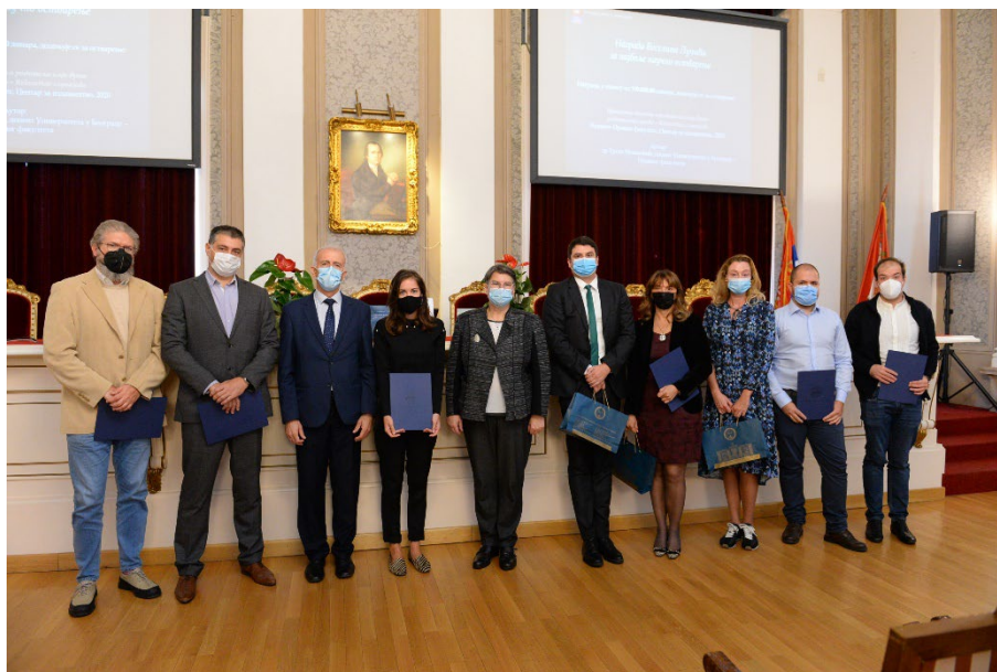
Добитници Награде Веселина Лучића за најбоље научно остварење наставника и сарадника