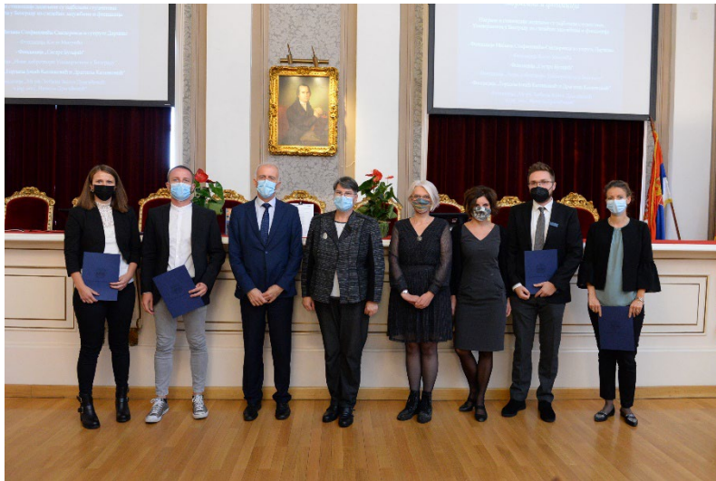
Добитници Награде Ђоке Влајковића