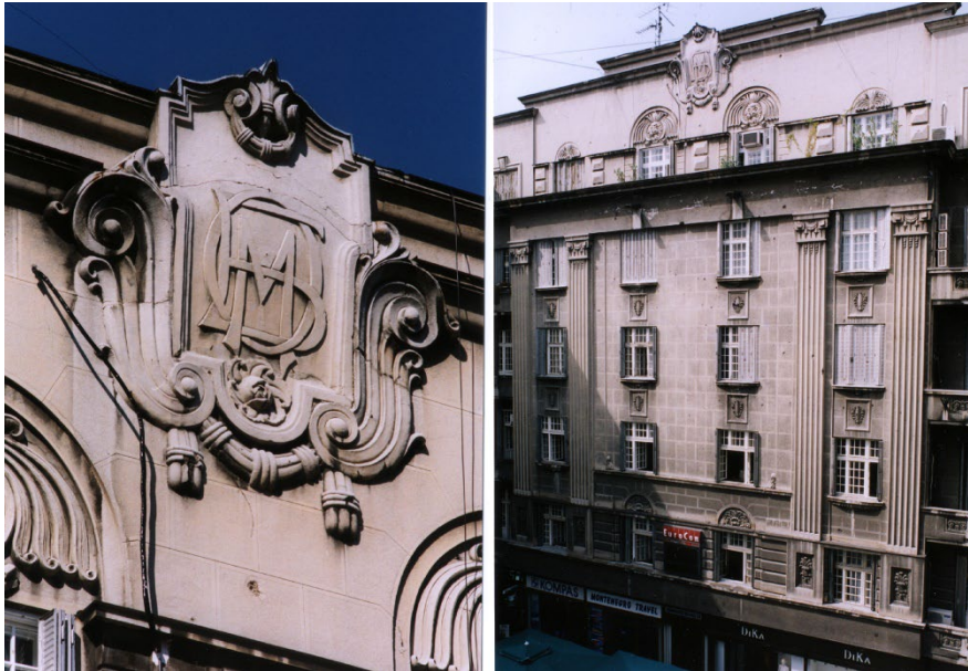
Београд, Обилићев венац 26